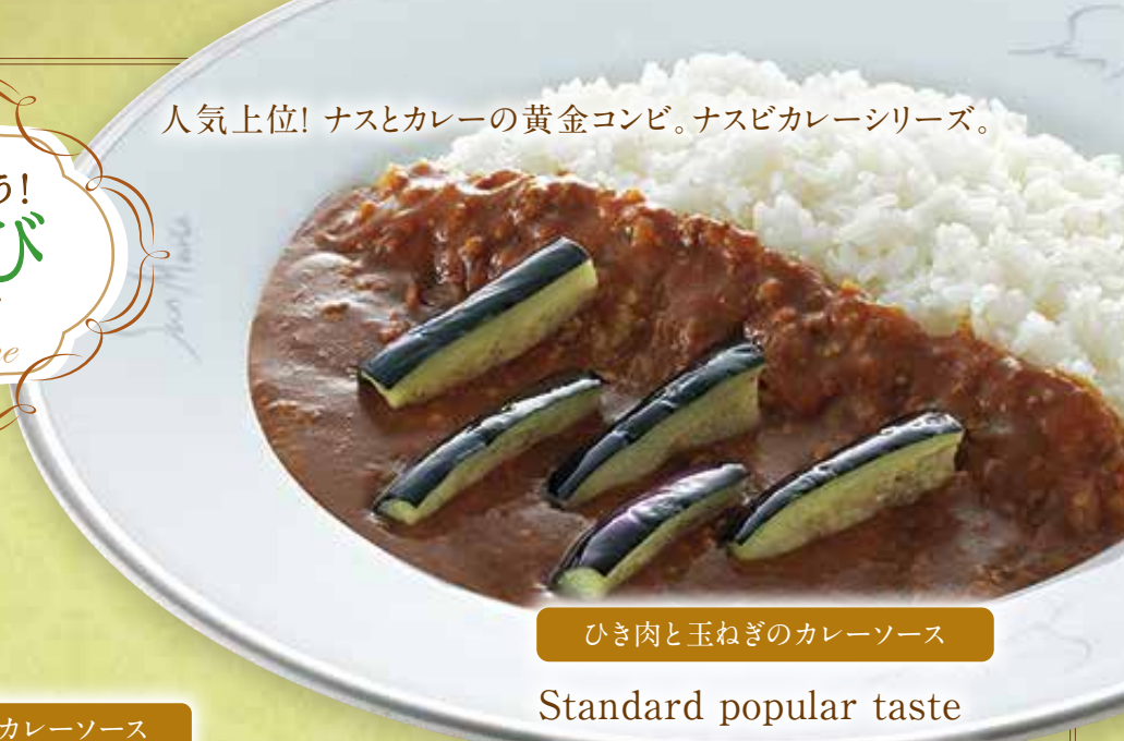
ひき肉と玉ねぎのカレーソース